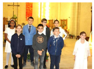
Premières communion octobre 2020

Nous avons gardé les travaux de peinture et/ou tapisserie que nous essaierons de réaliser par nous-mêmes. Le moment venu il sera fait appel toutes les bonnes volontés compétentes.